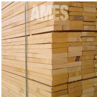
Tavola Abete Grezzo 100 x 23 x 4000 mm